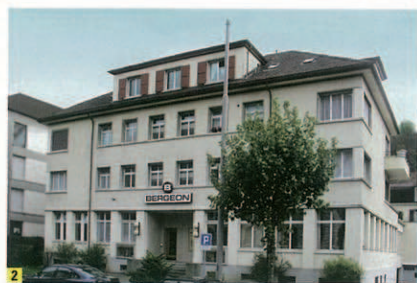
1ベルジンはスイスのル・ロワールに2つのオフィスを構え、60人のスタッフが働いている。工具のアッセンブリーやパッケージング、在庫管理など、すべての中心だ。そのほか香港に販売オフィスを設置している 2ル・ロワールのオフィスのひとつ。ここにセールス、マーケティング、商品開発、生産の各部門が入っている 3パーセルワールドのベルジジョン出展品 4 パーセル会場でもっとも原目立っていたベルジジョン・イエローのブース 5時計ファンなら、多彩なベルジジョン製品を見るだけでも十分に楽しめるはず