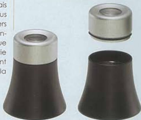
Loupe avec lentille additionnelle.