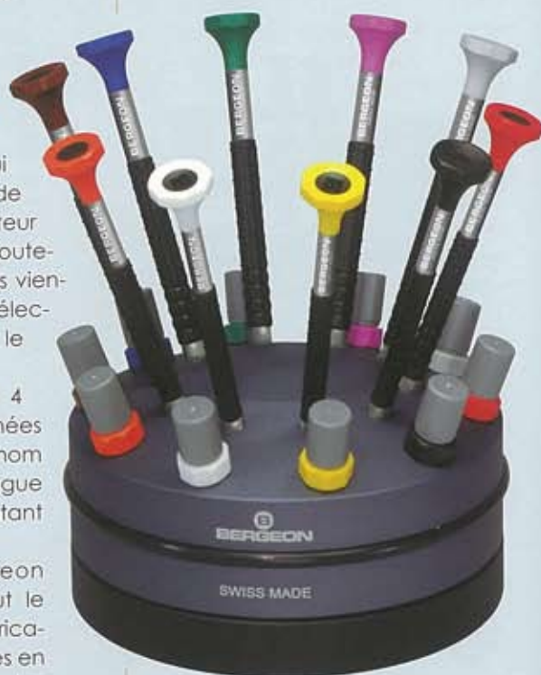
Jeu de 10 tournevis sur socle tournant. Avec emplacements pour les tubes et mâches de rechange.

Il y a aussi, Bergeon Integrator, une nouvelle unité, dont la mission est le