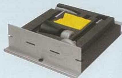
Tiroirs garnis pour le rhabillage.