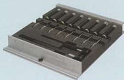
Tiroirs garnis pour le rhabillage.