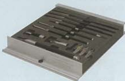
Tiroirs garnis pour le rhabillage.