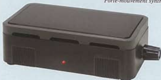
Réchaud à température fixe ou à température variable par potentiomètre.