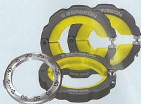
Extracteurs HH pour lunettes tournantes de grands diamètres Ø 30 à 50 mm.

BERGEON Tél. : +41 32 933 60 00 www.bergeon.ch