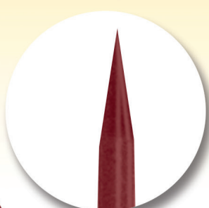
No 7216 200 mm Ø 5 mm